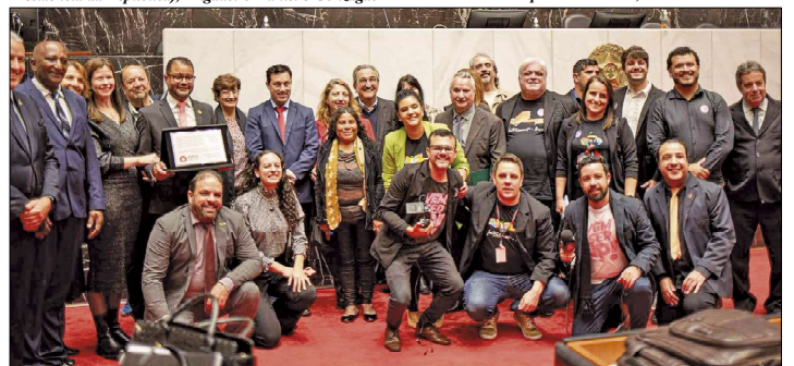
Comitiva sandumonense e autoridades presentes