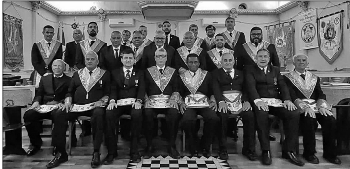
Nosso quadro atual