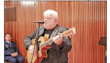
Secretário Municipal de Turismo, Fabrício Andrade