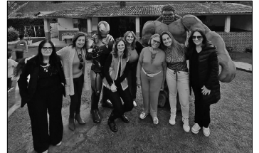
Tias, avó, Homem de Ferro e Hulk