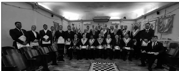
Final Sessão 1 c/visitantes