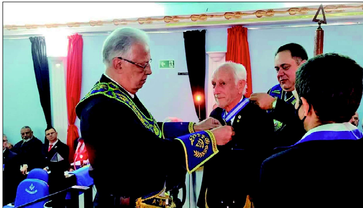
Grão Mestre entrega medalha "Delta da distinção"