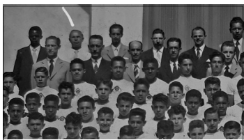
Corpo docente I e alunos