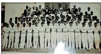
Corpo docente II e alunos - Igreja dos Passos